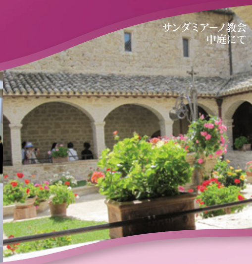
サンダミアノ教会 中庭にて