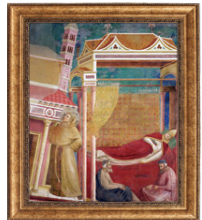
教皇イノセント3世の夢 (ジョット画) アシジ・聖フランシスコ教会