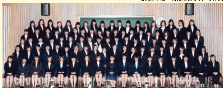
2016年度 文化総合学科 新入生