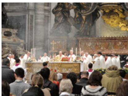
バチカンでクリスマスのミサ