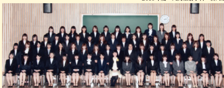
2016年度 人間生活学科 新入生

ですから、是非とも自由に、しかしやる時はやる！の精神で、大学生活を楽しんで下さい。