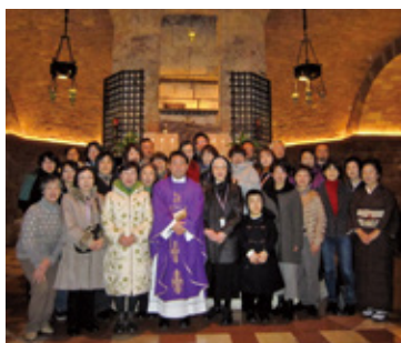
聖フランシスコのお墓の前で