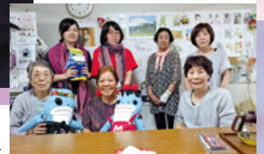
さおり織のストールを頂きました▶