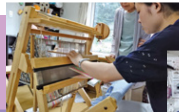
◀浄土ヶ浜仮設住宅で「さおり織」体験

この文章を読んでいただいて、少しでもボランティア活動に興味を持ってくださる方が増えたら嬉しいです。