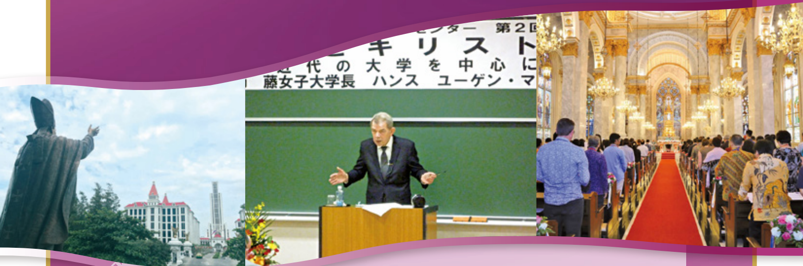
(中央)カトリックセンター講演会、(左右)ASEACCU 国際会議 in タイ