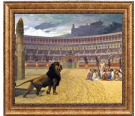
競技場で血を求める大群衆の前で殉教していくキリスト者たち