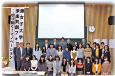
第1回 9月30日 (土)