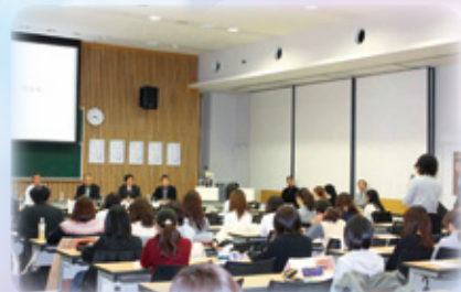
第3回 11月11日 (土)