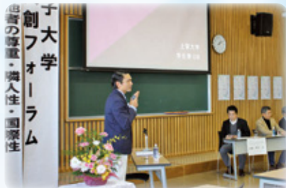
第2回 10月28日 (土)