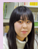
文学部 文化総合学科3年 K.Rさん

普段の授業では聞けないような、先生の素顔のお話を聞けて楽しかったです。和気あいあいとした時間で、藤の温かさを感じました。松本先生は学生時代の恩師の方たちの教えを大切になさっているのだと感じました。