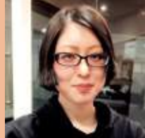
日本語・日本文学科 4年 K.Cさん