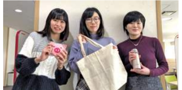
それぞれが愛用しているエコグッズを持って

この収録を通して、私たちが出来る環境問題への取り組みが身近なところからあるという事を改めて感じさせられました。今後学生リポーターとして学んだ事を学内に発信し、札幌市のゴミ問題について学生が関心を向けられるようなイベントを企画していきたいと考えています。そして札幌に住む者として、住みやすい街づくりに少しでも貢献できたらなと思っております。