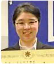
文学部 英語文化学科 3年 K.Mさん

私は英語文化学科の第二言語として、中国語を学んでいます。当初は、日本人に馴染みのある漢字が使われていることから、取り組みやすいだろうという不純な動機により学び始めました。しかし学んでいくにつれ、中国語の発音の美しさ、奥深さなどに徐々に魅了されていきました。そこで、学校のみならず、中国語の会話サークルに加入し、幅広い年代の異業種の方々と共に研鑽を積んで参りました。そうしたところ、中国語スピーチ大会の開催がある事を知り、自分がどのくらいのレベルに達しているかを知りたく、出場することにしました。大会前は、ゼミや講義の空き時間に自主練習を繰り返しました。また、先生の熱心なご指導や、多くの方のお力添えもあり、昨年10月に行われた「全日本中国語スピーチコンテスト北海道大会」で、暗誦の部の優勝と、大会特別賞を受賞することができました。今まで積み重ねてきた練習の成果が評価されて、大変嬉しかったです。