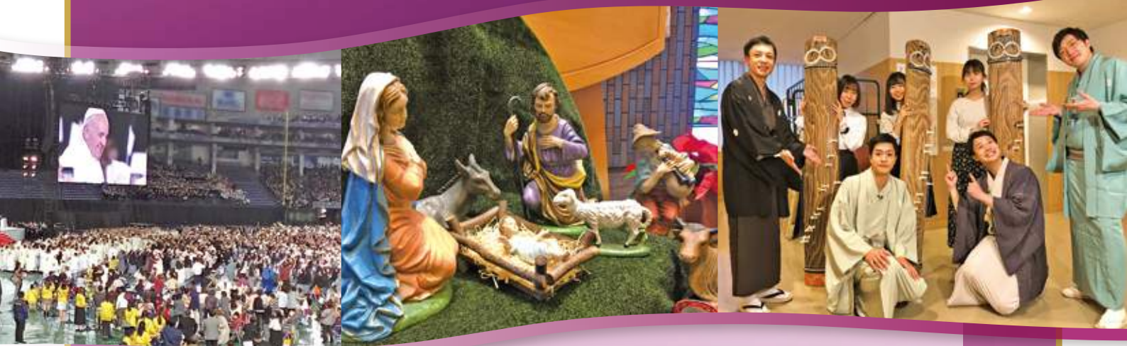
(右)番組収録で共演した箏曲部とフタツメン(若手落語家) (左)フランシスコ教皇様による東京ドームでのミサ