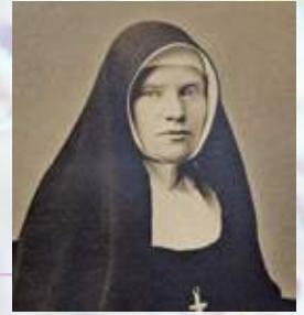
殉教者聖ゲオルギオのフランシスコ修道会 創立者ムッター・マリア・アンゼルマ

1869年11月25日北ドイツの片田舎テュイネで、藤学園の経営母体である私たちの修道会「殉教者聖ゲオルギオのフランシスコ修道会」が誕生し、昨年11月に創立150周年を迎えました。目の前の病人や子供たちへの愛の奉仕という使命感に駆られて、創立に当たっての様々な苦労や葛藤を神への信頼のうちに乗り越えた、創立者ムッター・マリア・アンゼルマの姿が浮かびます。