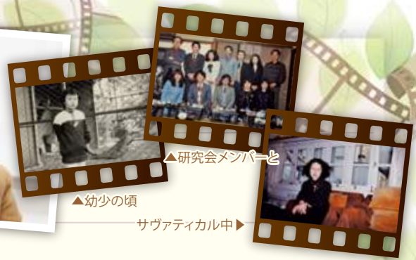
▲研究会メンバーと