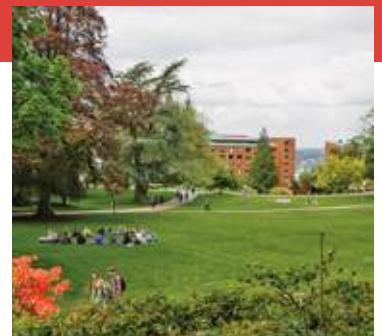
ウェスタンワシントン大学キャンパス

派遣先のウェスタンワシントン大学は、アメリカ西海岸ワシントン州の海と山に囲まれた自然豊かな環境にありながら、大都市シアトルとのアクセスもよい場所にあります。今後は、藤ACEプログラムの派遣先として、より長い期間の語学留学や学部留学も開始の予定です。