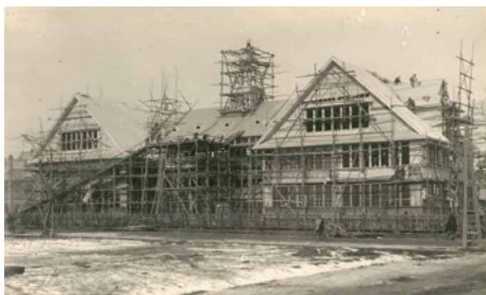
建築中の校舎写真。スイスの建築家マックス・ヒンデルの設計。北海道に残るヒンデルの作品としては、函館のトラピスチヌ修道院や、北星女学校教師館、ヘルヴェチア・ヒュッテなどがある。

先の(1)でも述べたように、藤高等女学校は、北海道において設立された最初の5年制の高等女学校であるという点に特徴がある。すなわち、1920(大正9)年に文部省から発令された「高等女学校令中改正」では第9条で修業年限に触れ、「高等女学校ノ修業年限ハ五箇年又ハ四箇年トス但シ土地ノ情況ニ依リ三箇年ト為スコトヲ得」とあるものの、当時の日本の高等女学校の大半は4年制であり、5年制の高等女学校は東京や大阪などの都市部に集中していた状況がある。