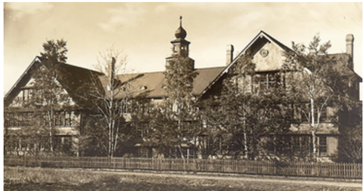
校舎写真。大正13(1924)年に完成した校舎の南側。9月28日に上棟式が行われた。

に輩出された117名の第1回卒業生たちの中には、直ちに家庭生活に入った者のほかに、東京女子大学や実践女子専門学校、東京女子医学専門学校、東京女子美術学校に進学した者が見られ、5年間の学業生活を通じて学生たちが上級学校に進む上で十分な学力を身に付けていたことを裏付ける(札幌教育委員会編『女学校物語(さっぽろ文庫35)』29、88頁)。